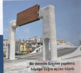
Bir derenin üzerine yapılmış höyüğe doğru açılan köprü.